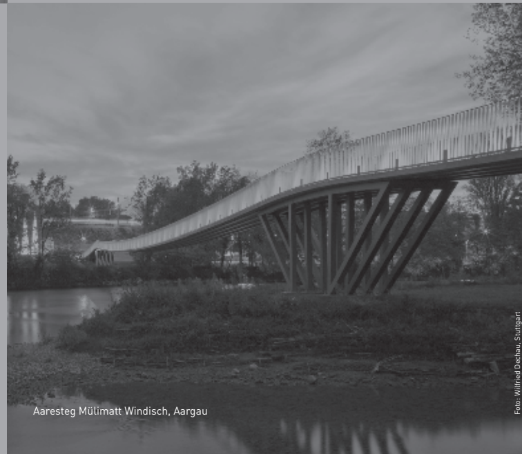
Aaresteg Mülimatt Windisch, Aargau