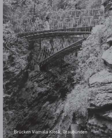
Brücken Viamala Kiosk, Graubünden

Kaltes und warmes Buffet und musikalische Umrahmung