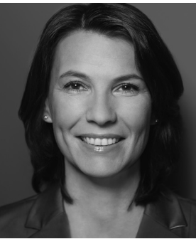
Rita Schwarzelühr-Sutter MdB, Wahlreis Waldshut, Mittelstandsbeauftragte für das Handwerk der SPD-Bundestags- fraktion

Die Podiumsdiskussion fand am 17. Juli im Forum der Handwerkskammer Region Stuttgart statt. Mehr auf unserer Homepage → Aktuell/Presse, Wahlprogramme: → www.bundestagswahl-bw.de/wahlprogramme1.html Wahlprüfsteine der Bundesingenieurkammer: → www.bingk.de/html/2608.htm