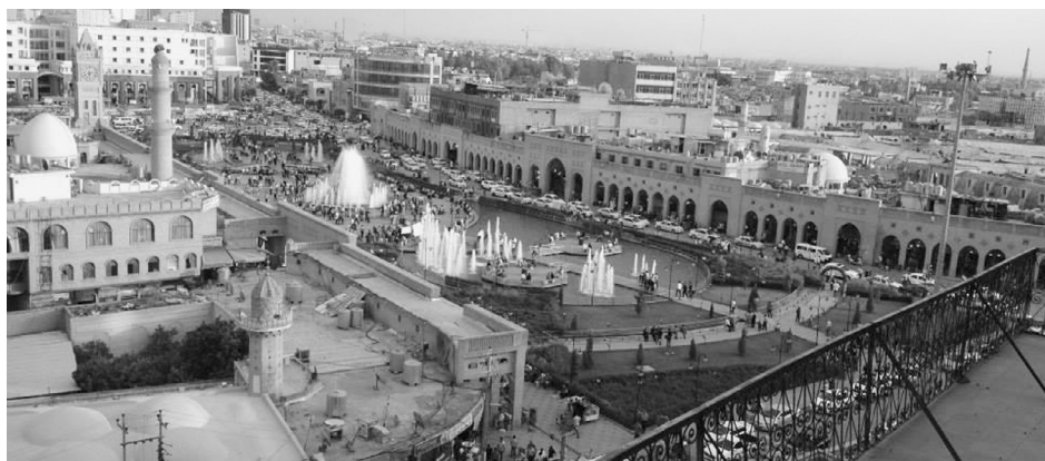
Die Hauptstadt Erbil